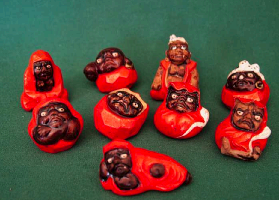
„Sieben Mal hinfallen, acht Mal aufstehen“ ( Nanakorobi, yaoki ). Neun unterschiedliche kleine Darumas aus Ton.

dass die Schneemänner auf Japanisch yuki-daruma heißen, also Schnee-Daruma.