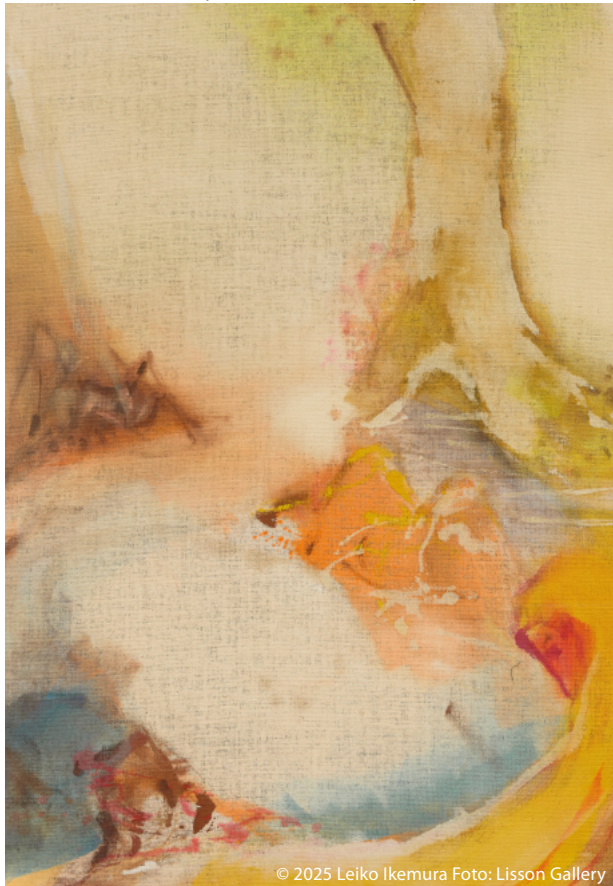
© 2025 Leiko Ikemura