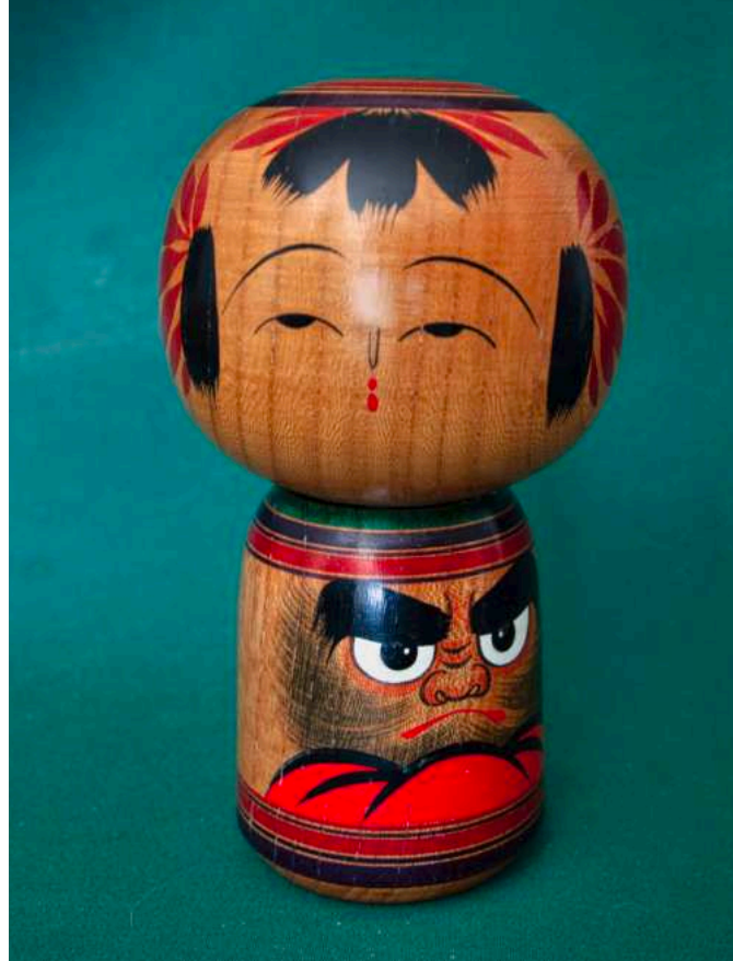
Kombination von Daruma und Kokeshi. Zelkoven-Holz, 9,0 x 14,5 cm.

Weibliche Daruma-Figuren kommen vor allem aus Westjapan, aus Kyūshū und aus Shikoku. Die sogenannten himedaruma 姫達磨 (Prinzessinnen-Daruma) aus Matsu-