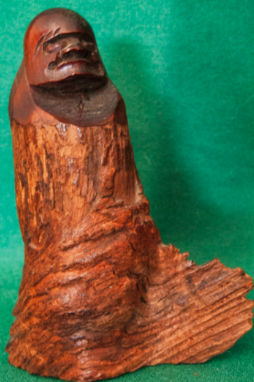
Holzdaruma, auf Blatt stehend bei der Überquerung des Meeres von China nach Japan. 7,5 x, 2,5 x 10,0 cm.

In der japanischen Kultur wird bei der Beschäftigung mit Daruma vor allem die Legende von der unendlich langen Meditation, der sich Daruma unterzog, in den Vordergrund gestellt. In ihr kommt ein wesentlicher Wert der japanischen Kultur und Gesellschaft zum Ausdruck, nämlich sich ganz einer Sache widmen, nie aufgeben, allen Widrigkeiten zum Trotz durchhalten. Das japanische Zeitwort ganbaru drückt das am besten aus. Häufig verabschieden sich Japaner mit dem