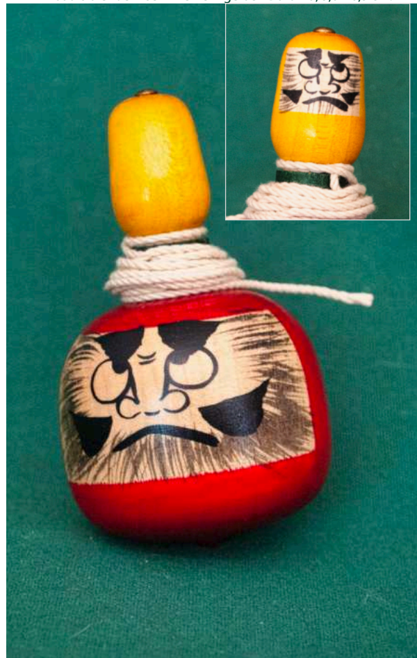
Kleiner roter Kreisel-Daruma mit aufsitzendem sehr kleinem gelbem Daruma, 5,0 x 8,5 cm.

yama in der Präfektur Ehime sollen auf die legendäre Herrscherin Jingū Kōgō (2.-3. Jh.), die Mutter des Ōjin Tennō, zurückgehen, die bei einem Aufenthalt in den heißen Quellen von Dōgō bei Matsuyama vor ihrem berühmten Korea-Feldzug merkte, dass sie schwanger war. Später begann man in Erinnerung an dieses Ereignis weibliche Stehaufpuppen als Amulette für leichte Geburt zu produzieren, die dann mit den Daruma-Puppen verschmolzen. Heute verkauft man