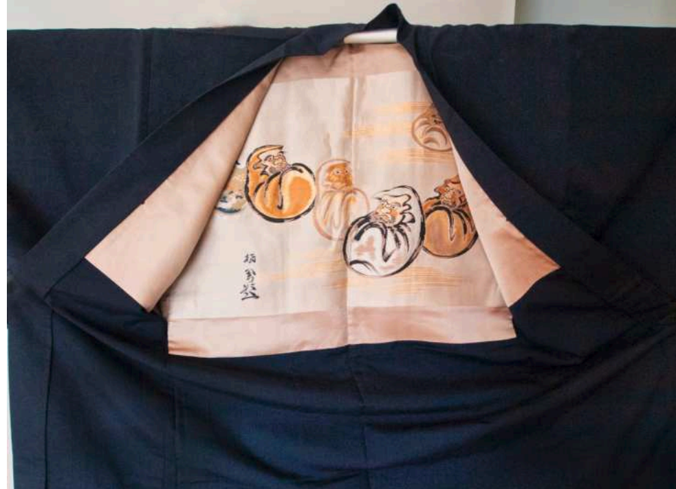
Überzieher ( haori ) eines Daruma-Liebhhabers, Futter mit Daruma-Muster. Breite 150 cm, Länge 105 cm.

beliebter Schauspieler, um die Zensur in den 1840er Jahren zu umgehen, die die Darstellung von Schauspielern verbot. Bei diesen Karikaturen auf Holzschnitten und bei einer Reihe humoristischer Bildpostkarten mit Darumas trafen sich mein Interesse an Darumas mit den Themen von zwei meiner früheren Ausstellungen. Auf der letzten Tafel mit dem Titel Daruma-Panoptikum trugen wir quasi den Rest an zweidimensionalen Objekten zusammen: Sticker, Sammelbilder, einen Briefmarkenblock, Werbung, etc. Wenig Beachtung fand wahrscheinlich eine Bahnsteigkarte, 8 x 12 cm, mit einem Bild von Daruma, ausgegeben zur Eröffnung der 68. Station Kaisei der Odakyū-Bahmlinie zwischen Shinmatsuda und Odawara im Jahr 1985. Diese Karte war wohl angelehnt an die Augenöffnungszeremonie von wichtigen Buddhastatuen und das davon abgeleitete Einmalen des zweiten Auges bei den Darumas. Medetai heißt „glücksverheißend“ und kann sprachlich in me , Auge oder Sprosse, und detai (etwas) möchte aufgehen, hervorkommen, zerlegt wer-