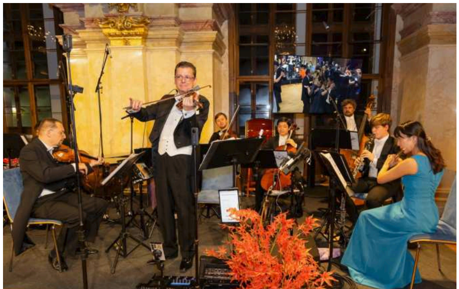
Wiener Royal Orchester

Ein fixer Höhepunkt Wiener Balltradition ist die Mitternachtsquadrille, die auch beim 2. Japan Ball Vienna nicht fehlen durfte. Den Auftakt bildete eine Einführung in den Bon-Odori , bei der die Gäste die Bewegungen dieses traditionellen japanischen Gruppentanzes erlernten – eine japanische Entsprechung der Quadrille. Punkt Mitternacht folgte schließlich die klassische Mitternachts-