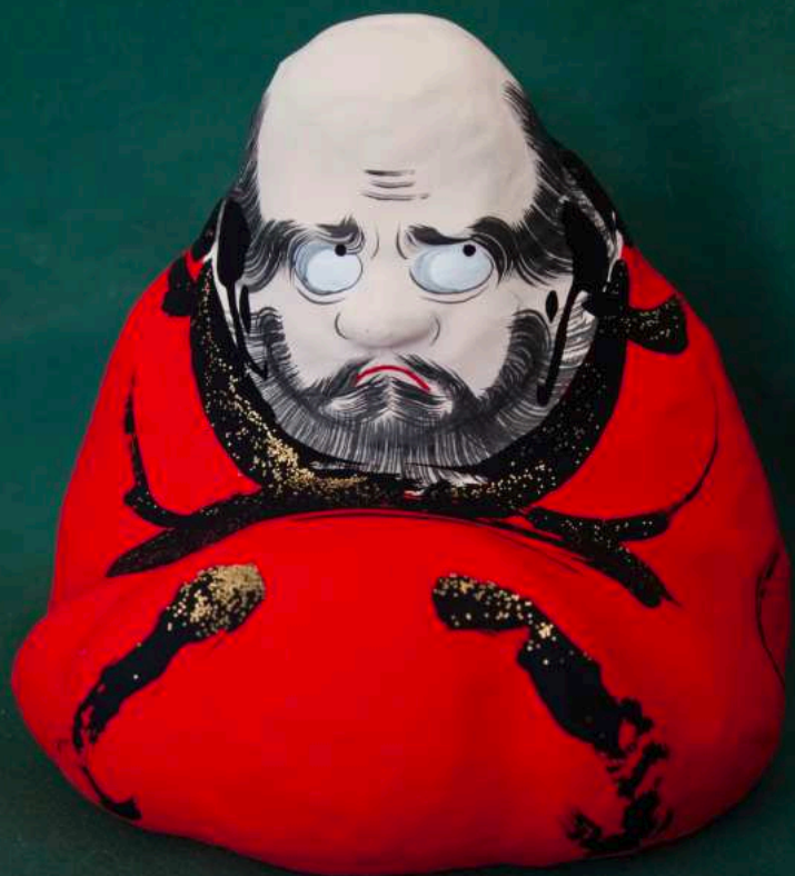
Der meditierende Daruma. Pappmaché, 16,5 x 13,5 cm.

Augenlider immer wieder zugefallen seien, hätte er sie einfach abgeschnitten und weggeworfen, woraus dann die ersten Teesträucher gewachsen seien. Für Japan gibt es noch weitere Legenden: Um den Zen-Buddhismus noch weiter zu verbreiten, habe er von China aus, abermals auf einem großen Blatt, über das Meer nach Japan übersetzt. Dort habe er noch den berühmten Regenten Shōtoku Taishi getroffen und sei am nächsten Tag gestorben. Als Kulturheros habe er auch noch die Tee-pflanze nach Japan mitgebracht.