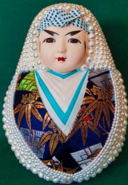
Perlenbrokatdaruma, wie ihn Königin Elisabeth II bei ihrem Besuch von Ise und der Mikimoto-Perlen-Zucht im Jahr 1975 als Geschenk bekam.

sie wegen des Gleichklangs EHIME und HIME daruma als besonderes Produkt der Präfektur. Auf etlichen Bildern wird Daruma gemeinsam mit Kurtisanen gezeichnet, um anzudeuten, dass diese sogar für einen heiligen Mann wie ihn eine große Versuchung darstellten. Auch als großer Esser oder Trinker wird er gerne gezeichnet, obwohl sich Völlerei und Reiswein für einen heiligen Mönch nicht geziemen, aber nach neun Jahren Abstinenz ist auch dieses Verhalten verständlich.