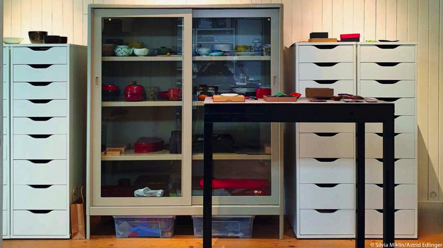
Silvia Miklins Lackkabinett im 7. Bezirk

B ei japanischem Lack – Urushi – denkt man meist zuerst an exquisite gold-verzierte Schatullen oder prächtige Wandtäfelungen in alten Schlössern. Aber Urushi ist vielseitig einsetzbar und geht mit der Zeit. Die in Wien lebende Restauratorin Silvia Miklin – sie hat Metallrestaurierung an der Universität für Angewandte Kunst studiert und auch dort unterrichtet – ist mit Urushi-Lack erstmals während ihres Studiums in Kontakt gekommen, eigentlich als Randgebiet der Metallrestaurierung.