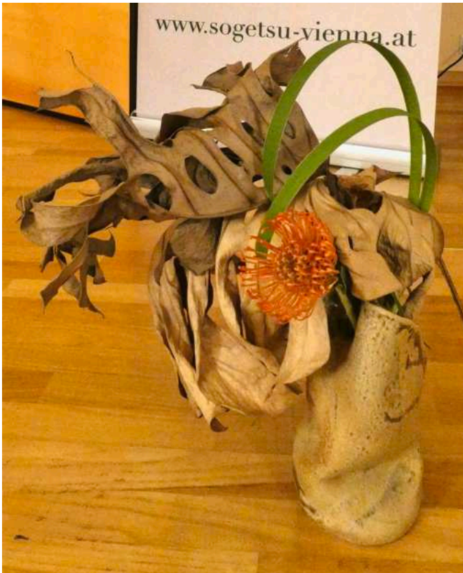
Auch aus dürren Blättern – hier vom Philodendron – lassen sich interessante abstrakte Skulpturen schaffen.

vielfältigen kreativen Möglichkeiten zeigen, obwohl alle dieselben Materialien zur Verfügung hatten: Neuseelandflachs, Grasnellen, Lisianthus und Nerinen. Kein Gesteck gleicht dem anderen, alle haben ihre persönliche Ausdrucksform gefunden.