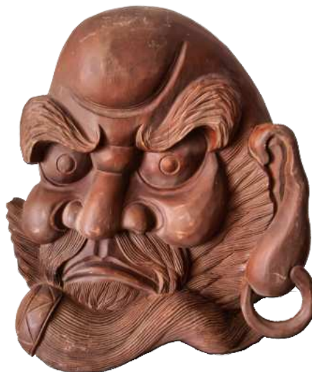
Geschäftszeichen ( kanban ) aus Holz, das auf ein Darumaya hinweist. Ca. 60 cm hoch, 52 cm breit und 12 cm dick.

den. Wenn ein Auge oder eine Sprosse aufgeht, das ist Glück ( fuku ), und Glück zu bringen, ist die wichtigste Funktion aller Darumas.