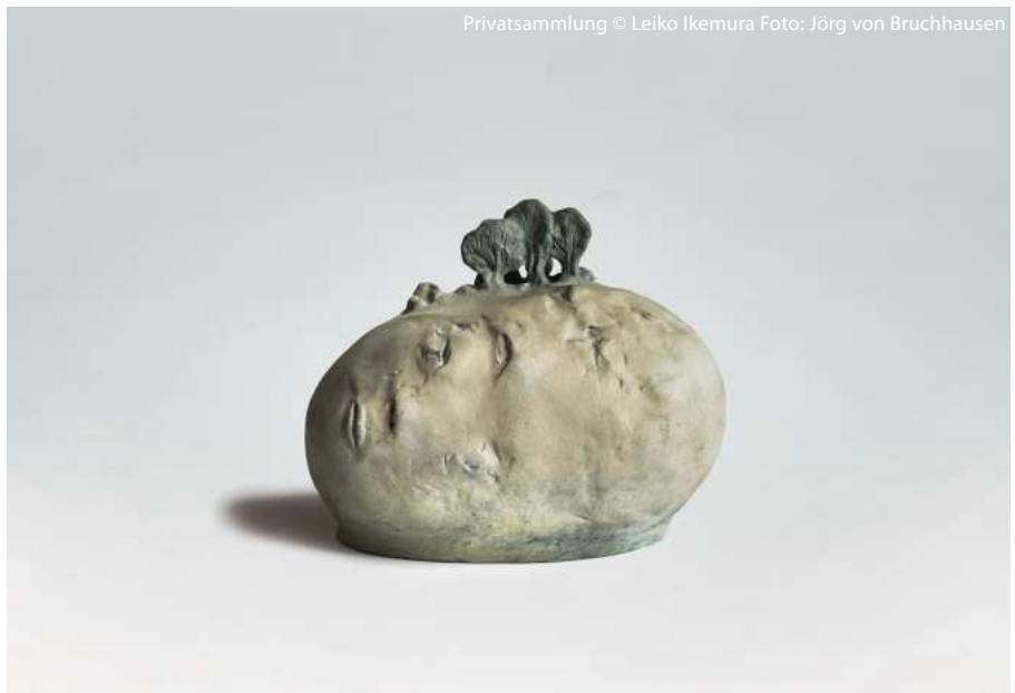
Leiko Ikemura / Trees Out Of Head 2020/2015

zur Begegnung mit dem Anderen – und damit dem Erkennen des eigenen Selbst – zeigt sich ein konstantes Ringen um die Befragung unseres Daseins.“