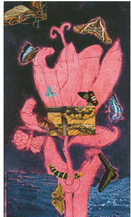
Self-Portrait, 1972 Collage, Pastell, Kugelschreiber und Tusche auf Papier 74,4 x 44 cm, Sammlung der Künstlerin © Yayoi Kusama

erzeugte Monotonie verwirrte den Betrachter, das Suggestive und Ruhige zog ihn in einen Strudel aus Nichts.“