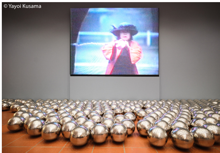
Installationsansicht Museum Ludwig Köln, 2026 Flower of Basara, 1985 Sammlung der Künstlerin Narcissus Garden, 1966/2026 2.000 Edelstahlkugeln Sammlung der Künstlerin Courtesy of Ota Fine Arts and David Zwirner

Unbeschwert war ihre Jugend jedoch nicht: einerseits war die Ehe ihrer Eltern schwierig und deren Verhältnis zu ihrer Tochter ebenso, andererseits waren die Jahre von Kriegen überschattet, die im August 1945 – nur wenige hundert Kilometer von Matsumoto entfernt – in den Atombombenabwürfen von Hiroshima und Nagasaki gipfelten. Yayoi war damals 16 Jahre alt, ein Bild Atomic Bomb , neun Jahre später entstanden, ist in der Ausstellung zu sehen. Mag sein, dass die Spannungen im Familienleben ebenso wie die Kriegereignisse sich auf das Seelenleben des sensiblen Mädchens auswirkten – im Alter von nicht einmal zehn Jahren traten bei ihr erstmals Halluzinationen auf. In ihrer