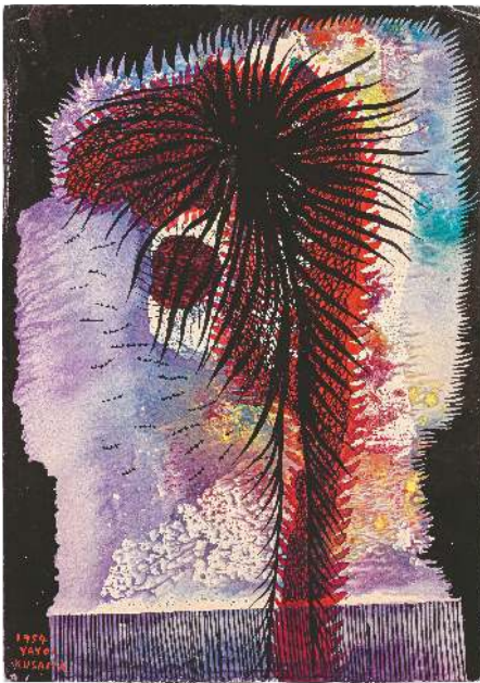
Atomic Bomb, 1954 Gouache, Tusche und Pastell auf Papier 25 x 17,6 cm Matsumoto City Museum of Art © Yayoi Kusama

Wahrnehmung überwucherten Punkte, Blüten und andere Muster nicht nur ihren Körper, sondern auch ihre Umgebung. Die damit verbundene Erfahrung von Auslöschung machte ihr Angst, gleichzeitig erlebte sie dabei auch ein Gefühl der Verschmelzung mit einem „großen Ganzen“, etwas das sich in vielen ihrer Werke widerspiegelt. Yayoi zeichnete unermüdlich – sie wollte Malerin werden, was keineswegs zu den Vorstellungen ihrer Mutter für die Zukunft der Tochter passte. Schließlich wurde der 19-jährigen erlaubt an der Städtischen Oberschule für Kunst in Kyoto zu studieren, allerdings unter der Bedingung parallel dazu auch Unterricht in Japanischer Etikette zu nehmen. Das Studium an der Kunstschule in Kyoto war erst seit kurzer Zeit für Frauen zugänglich und basierte auf traditionellen Techniken und