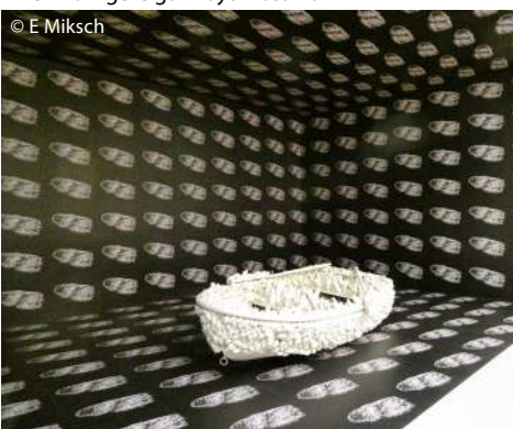
Aggregation: One Thousand Boats Show – ursprünglich 1963 in der Gertrude Stein Gallery in New York gezeigt © Yayoi Kusama

Gegen Ende 1957 brach sie auf in die USA, nach wenigen schwierigen Monaten in Seattle kam sie nach New York, wo sie die kommenden 15 Jahre verbringen sollte. Der Anfang war nicht einfach – weder in künstlerischer noch in finanzieller Hinsicht. Intensive Schaffensphasen wurden unterbrochen durch Halluzinationen und Panikattacken, die sie wiederum durch Arbeit zu überwinden suchte. Gerade in dieser Zeit entstanden die ersten Infinity Net-Gemälde – fast monochrome Gemälde in teils riesigen Formaten, die sie mit einer Unzahl von winzigen Bögen oder netzartigen Strukturen füllte. Sie selbst sagte, dass der Anblick des unendlich weiten Ozeans auf ihrem Flug von Japan in die USA sie dazu inspiriert hatte. Fünf dieser Gemälde wurden 1959 in der New Yorker Brata Gallery gezeigt und von der New Yorker Kunstwelt begeistert aufgenommen. Eines dieser Gemälde fand seinen Weg nach Europa und Kusamas Werk wurde damit erstmals der europäischen Kunstszene präsentiert. Kusama selbst über ihre Infinity Net-Gemälde : „Die durch die Wiederholung immer gleicher Muster ohne Komposition und Mittelpunkt