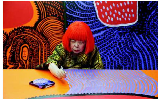
Yayoi Kusama bei der Arbeit an My Eternal Soul (2009-21), 2017

In ihrem Klinik-Atelier experimentierte sie in den späten 1970er Jahren mit verschiedenen Drucktechniken, in denen sie Motive wie Blumen, Schmetterlinge, Kürbisse und anderes gestaltete. Das Kürbismotiv hatte sie schon seit ihrer Kindheit begleitet und nimmt in den frühen 1980er Jahren eine wichtige Rolle in ihren Arbeiten ein. In ihrer Autobiographie beschreibt sie, wie sie mit ihrem Großvater auf einem Spaziergang durch ein Blumenfeld einen menschen-kopfgroßen Kürbis entdeckt hat. Sie pflückte den Kürbis und war fasziniert von seiner taufeuchten Oberfläche, die sich so angenehm anfühlte. In ihrer Fantasie wurde der Kopf lebendig und begann mit ihr zu sprechen. Seit damals hat sie unzählige Kürbisse gezeichnet und in verschiedensten Materialien gestaltet. Ihre Arbeit führt sie unermüdlich weiter – ihre Infinity Mirror Rooms , die in kleinem Ausmaß als eine Art Guckkasten in ihrem Schaffen weit zurück reichen, wurden weiterentwickelt