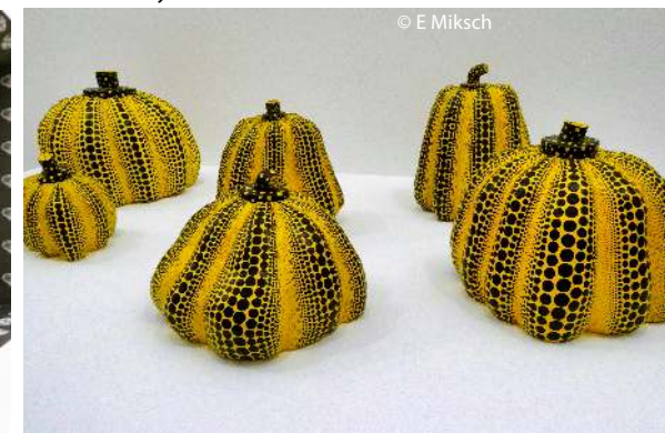
Kürbisse begleiteten die Künstlerin von Kindheit an – in Zeichnung, Malerei, Plastik und auch in ihren Gedichten. Pumpkins, 1998-2000, Sammlung der Künstlerin © Yayoi Kusama

Wenig später erweiterte Kusama das Prinzip der sich ausbreitenden Muster von der Fläche ins Dreidimensionale – ihre Soft Sculptures und Accumulations entstanden. Dabei handelt es sich um hunderte von ihr genähte, ausgestopfte und mit Farbe bemalte Stoffgebilde in phallischer Form, mit denen sie Möbelstücke und andere Gegenstände bedeckte. Auf diese Art wollte sie sich ihrer Phallophobie und sexuellen Abneigung stellen. Das berühmteste dieser Werke war die 1963 in der New Yorker Gertrude